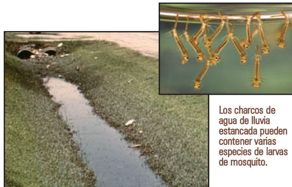
Los charcos de agua de lluvia estancada pueden contener varias especies de larvas de mosquito.

Si hubiera síntomas, estos se presentan entre los 3 y 14 días después de la picadura de un mosquito infectado.