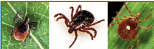
La garrapata de patas negras o garrapata del venado